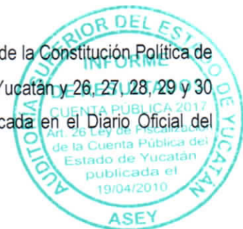
H. Ayuntamiento de Chumayel

El presente Informe de Resultados se emite con fundamento en los artículos 134 de la Constitución Política de los Estados Unidos Mexicanos; 43 Bis de la Constitución Política del Estado de Yucatán y 26, 27, 28, 29 y 30 de la Ley de Fiscalización de la Cuenta Pública del Estado de Yucatán, publicada en el Diario Oficial del Gobierno del Estado de Yucatán el 19 de abril de 2010.